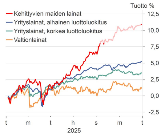
Korkomarkkinoiden tuotot vuonna 2025